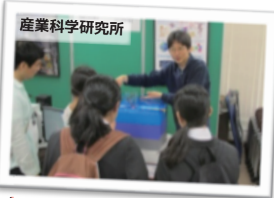
産業科学研究所 ナノテクノロジーで生体分子を測る

5月1日(日)「科学の教室」の企画として、主に理工系の研究室を見学するために大阪大学に行きました。1年生36名、2年生7名、3年生4名の計47名の参加で、朝7時に大型バスで出発し吹田キャンパスに行きました。広大で緑豊かな吹田キャンパスには、工学部、医学部、薬学部等の学部と、産業科学研究所、微生物病研究所など幾つもの研究所があります。約2時間半の自由行動時間に、生徒達はパンフレットを片手に関心のある研究室を巡り見学しました。午後はバスで豊中キャンパスに移動し理学部と基礎工学部を中心に自由に研究室を見学しました。