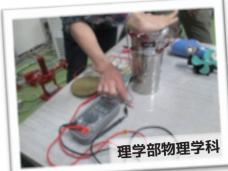
理学部物理学科 温度差で発電する熱電素子の実験

訪問した研究室では実験機器を前に丁寧に説明して頂いたり、時には実験をさせて頂くこともできました。参加した生徒は大学での学問・研究の世界に触れることで、その基礎となる高校での学習に対する意欲を高めることができたと思います。