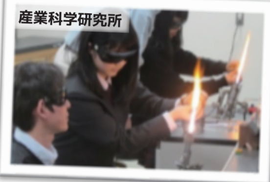
産業科学研究所 ガラス棒を加熱してマドラーを制作