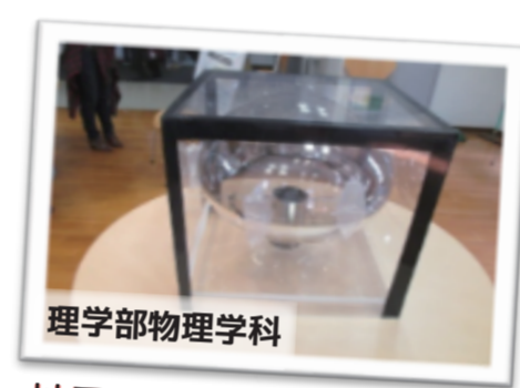
理学部物理学科 神岡の地下で宇宙を探る放射線検出器