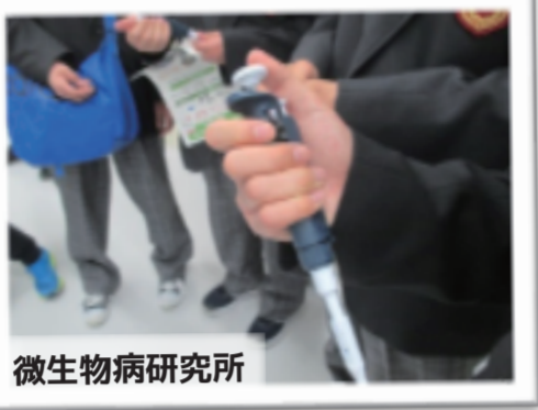
微生物病研究所 生化学実験で使うピペットマンを操作

訪問した研究室では実験機器を前に丁寧に説明して頂いたり、時には実験をさせて頂くこともできました。参加した生徒は大学での学問・研究の世界に触れることで、その基礎となる高校での学習に対する意欲を高めることができたと思います。